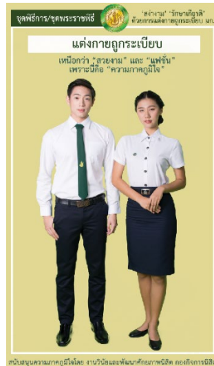
รูปที่ 3 เครื่องแบบนิสิตชุดพิธีการ ชุดพระราชพิธี

หมายเหตุ สำหรับนิสิตที่ได้รับมอบหมายให้ปฏิบัติหน้าที่พิเศษในงานพระราชพิธี ให้แต่งกายตามที่อาจารย์ดูแลในงานพิธีนั้นกำหนดให้แต่ง