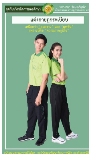
รูปที่ 4 ชุดเครื่องแบบวิชากิจกรรมพลศึกษา