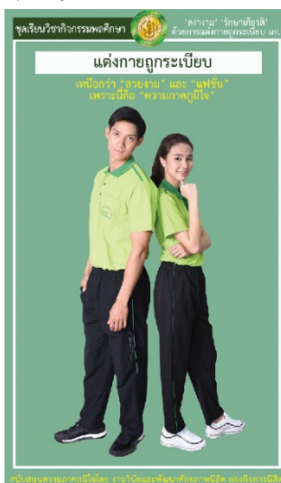
รูปที่ 4 ชุดเครื่องแบบวิชากิจกรรมพลศึกษา