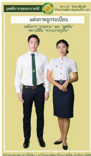
รูปที่ 3 เครื่องแบบนิสิตชุดพิธีการ ชุดพระราชพิธี

หมายเหตุ สำหรับนิสิตที่ได้รับมอบหมายให้ปฏิบัติหน้าที่พิเศษในงานพระราชพิธี ให้แต่งกายตามที่อาจารย์ดูแลในงานพิธีนั้นกำหนดให้แต่ง