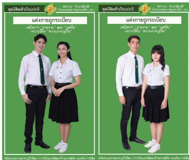
รูปที่ 2 เครื่องแบบนิสิตปกติ ชุดเข้าเรียนปกติ